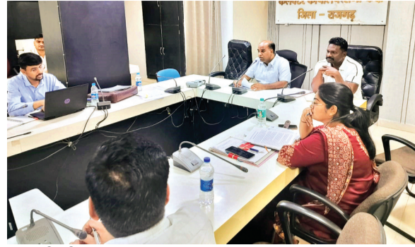
हरिभूमि न्यूज ▶▶ राजगढ़

जिले में संचालित वैक्सिनेशन अभियान में लापरवाही को गंभीरता से लेते हुए कलेक्टर ने संबंधित अधिकारियों के विरुद्ध सख्त रुख अपनाया है। कलेक्टर डॉ गिरीश कुमार मिश्रा द्वारा शुक्रवार को आयोजित समीक्षा बैठक में टीकाकरण कार्य की प्रगति का विस्तृत मूल्यांकन किया गया, जिसमें स्वास्थ्य विभाग एवं शिक्षा विभाग के वरिष्ठ अधिकारी उपस्थित रहे। बड़ी बात यह है की स्वास्थ्य में लापरवाही पर जिले के 53 सीएचओ को कारण बताओ सूचना पत्र जारी किए गए हैं।