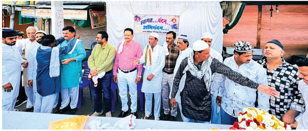
द्वारा रखा गया जहां पर मौजूद प्रशासनिक अधिकारी कर्मचारी एवं पत्रकार बंधुओं ने इत्र पान कराकर एक दूसरे को गले लगा